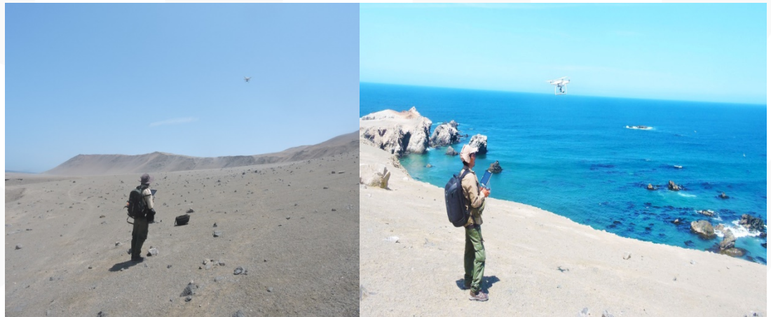
Descripción fotografía: Guardaparques en la bahía de Paracas

Asimismo, acciones preliminares en el Puesto de Control de Santo Domingo en donde se encargan del control, orientación y cobro por el derecho de ingreso a los turistas que visitan el ANP.