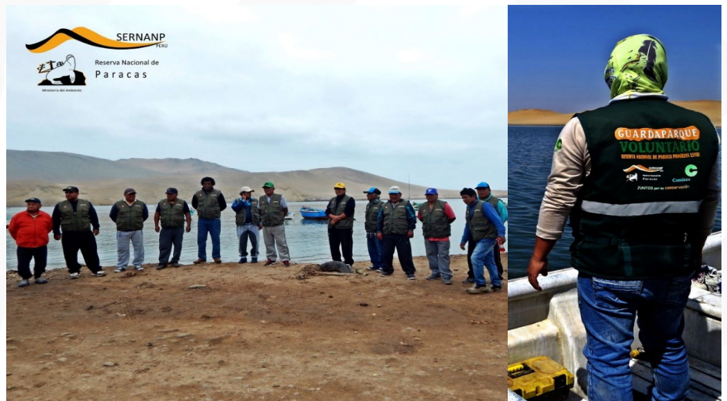
Descripción fotografía: Guardaparques uniformados listos para sus actividades cotidianas de control y vigilancia de la RNP.

El proyecto permitió dotar de uniformes a los guardaparques voluntarios, los mismos que permiten identificarlos en sus actividades de control y vigilancia en los ámbitos de gestión del área natural, así como generar un vínculo de identidad con la institución.