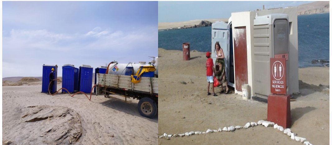
Descripción fotografía: Baños químicos instalados en la RNP

Se alquilaron 09 baños químicos, los cuales fueron dispuestos estratégicamente en las diferentes playas y zonas de la RNP, con el fin de tener el número adecuado de baños a disposición, y en buenas condiciones, para los turistas que visitan el área, especialmente en la temporada de verano. Además, estos baños recibieron el mantenimiento se realizó dos veces por semana.