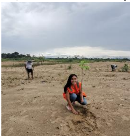
Figura N.º 3. Mujer minera de AMATAF en piloto de reforestación