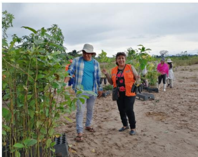
Figura N.º 4. Presidenta de AMATAF en piloto de reforestación