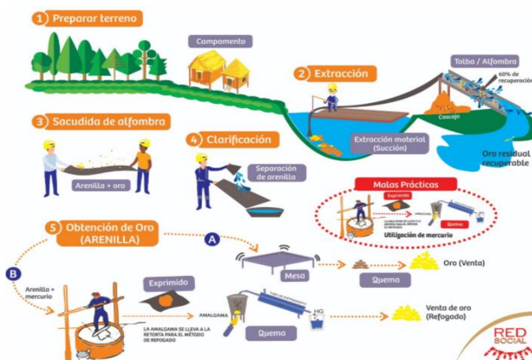
Figura N.º 2. Ciclo de la producción en la minería aluvial de Madre de Dios