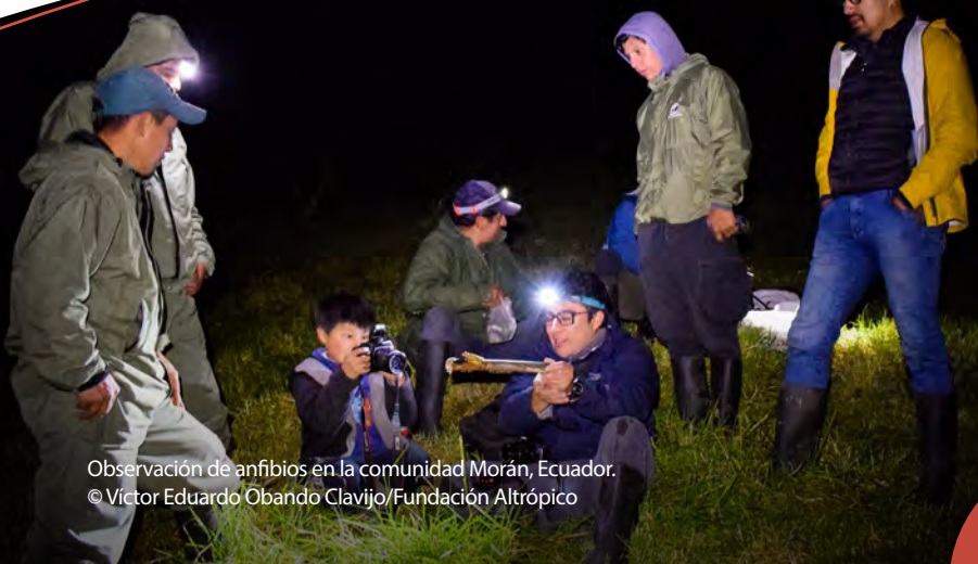
Observación de anfibios en la comunidad Morán, Ecuador.