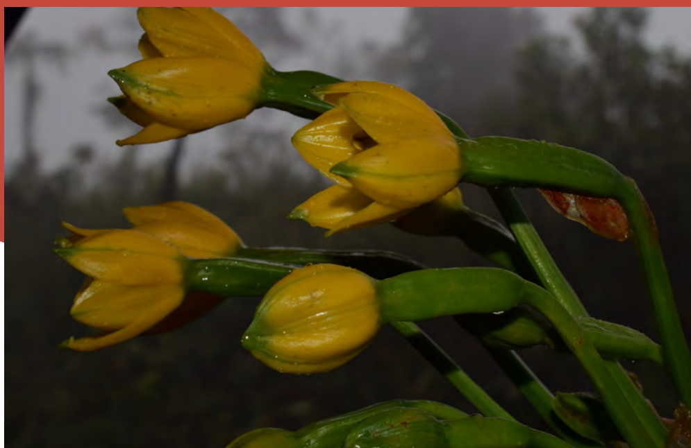
Pamianthe ecollis , en Vereda Nuevo Horizonte-Argelia-Colombia.

La mejora en la gestión en KBA se logró a través de una gama completa de acciones, como la aprobación de planes de gestión de nuevas áreas protegidas, actualización de los mismos con participación comunitaria en la gestión; y proyectos agroforestales que evitaron la invasión de áreas de conservación y que ayudaron a la restauración de áreas degradadas.