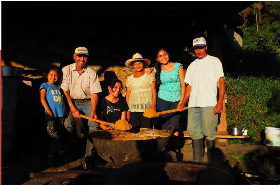
Intercambio de conocimientos sobre panela.

CEPF promovió la conservación de paisajes productivos a través de incentivos y pequeñas empresas relacionadas al ecoturismo, café sostenible, pagos por servicios ecosistémicos y acuerdos, que en conjunto proporcionaron grandes incentivos económicos para la conservación.