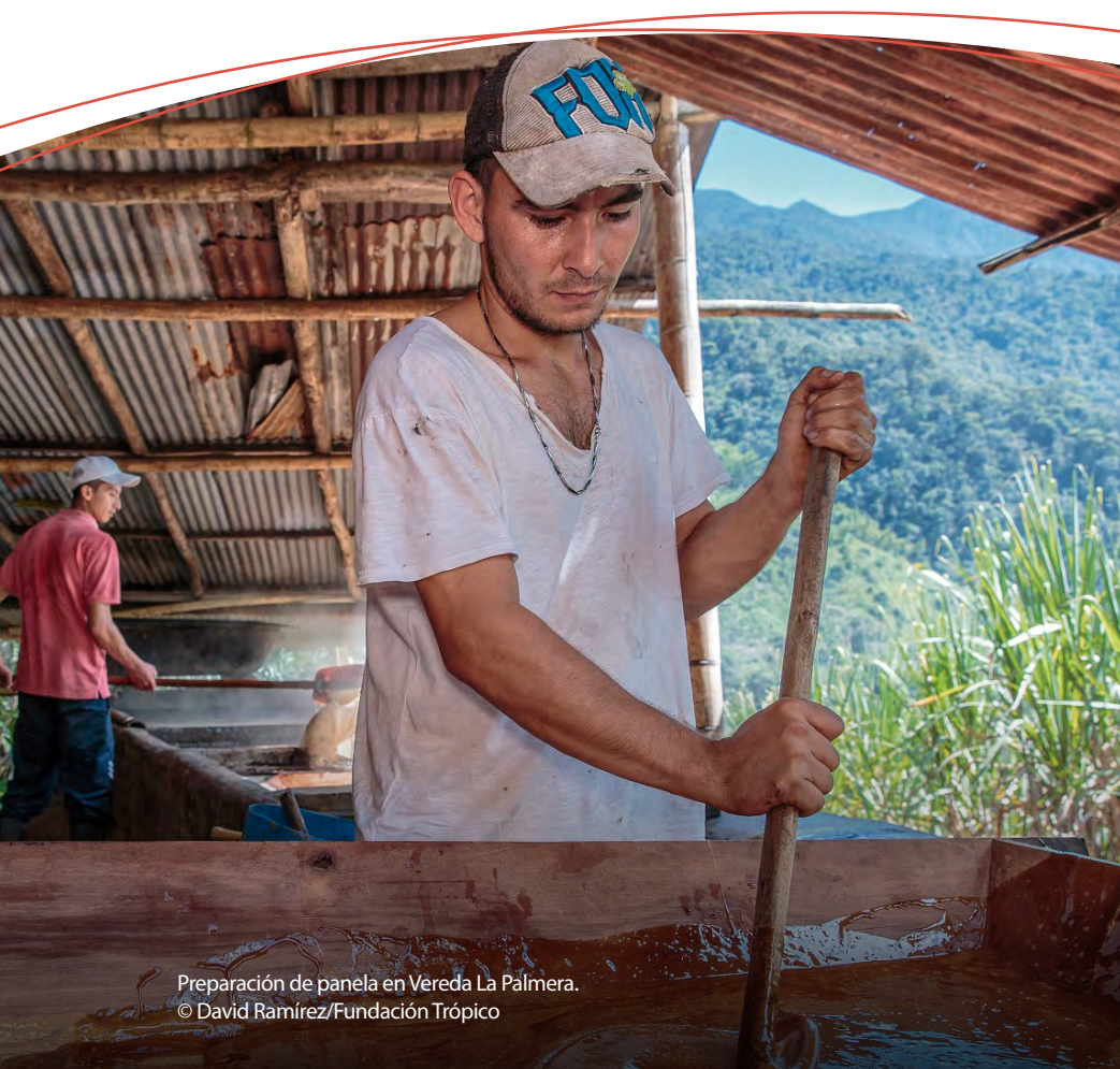
Preparación de panela en Vereda La Palmera.