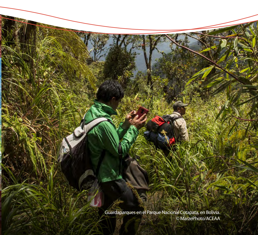
Guardaparques en el Parque Nacional Cotapata, en Bolivia.