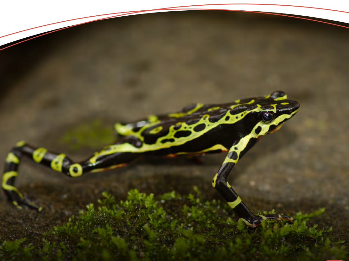
Atelopus wampukrum sp., en la Reserva Natural Maycú