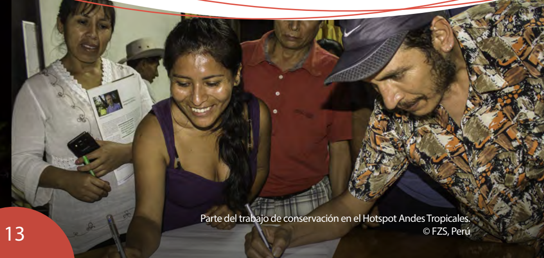
Parte del trabajo de conservación en el Hotspot Andes Tropicales.