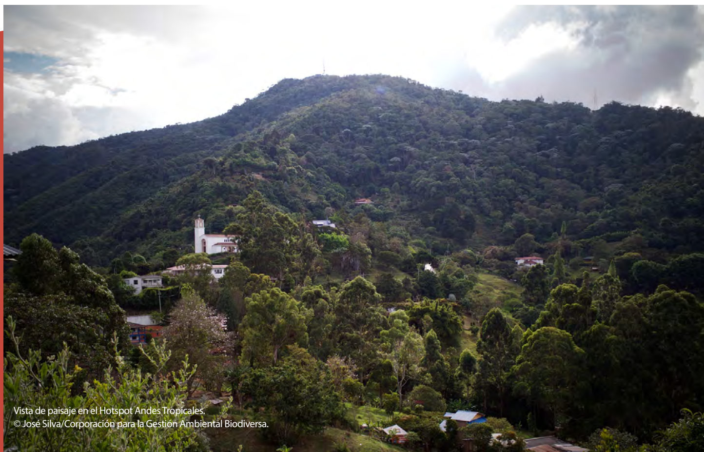
Vista de paisaje en el Hotspot Andes Tropicales.

Estas alianzas ayudaron a los beneficiarios a aprovechar las diferentes experiencias y capacidades disponibles dentro de la “familia” del CEPF en los Andes Tropicales, generando así procesos más eficientes y optimizando los impactos de las diversas subvenciones.