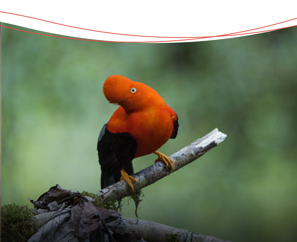
Gallito de las rocas, rupicola peruvianus .