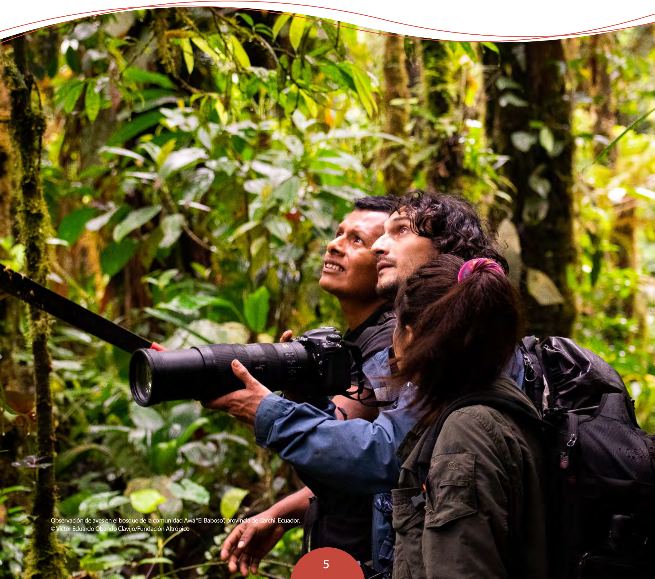
Observación de aves en el bosque de la comunidad Awá "El Baboso", provincia de Carchi, Ecuador.

El rol del RIT en el Hotspot Andes Tropicales ha sido clave en la gestión de las subvenciones, en el asesoramiento técnico, en el desarrollo de procesos clave en la generación de capacidades, en el monitoreo de los impactos de conservación generados por los proyectos, y en la promoción y difusión de los resultados.