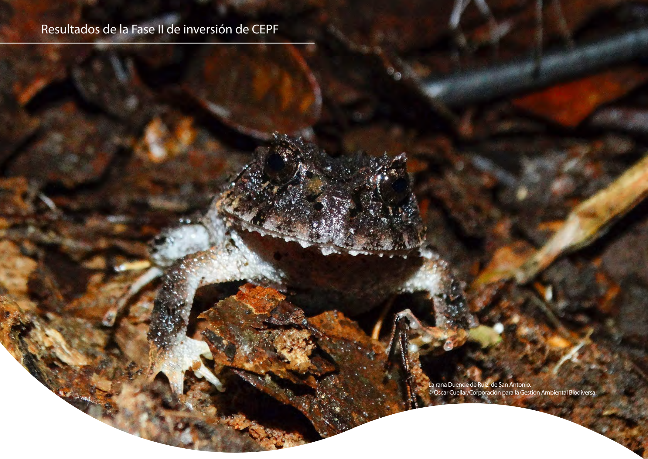
La rana Duende de Ruiz, de San Antonio.